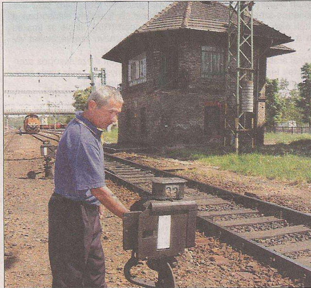
Sokféle állnak jobb sorsra érdemes épületek a sínek mellett

Az idő és a tolvajok nem kímélték a különféle racionalizálások és létszámleépítések kapcsán üresen maradt somogyi bakházakat, megállókat, állomásépületeket. Információnk szerint hét éve áll gazdátlanul a belegi vasúti órház. Környékét felverte a gaz. Az egyszintes épületből minden mozdítható értéket elvittek, még a tetőt is megbontották. Hasonló sors jutott a répáspusztai állomásnak: lakója évekkal ezelőtt elköltözött. Nemcsak a főépület, hanem az egykori gaz-